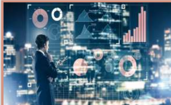
۳- هوش تجاری