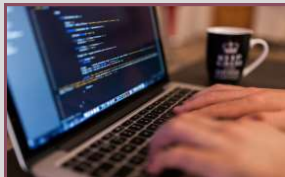
۶- برنامه نویسی