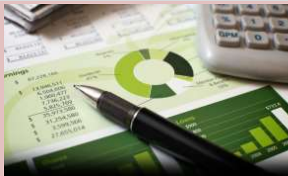
۲- کاربر حرفه ای اکسل