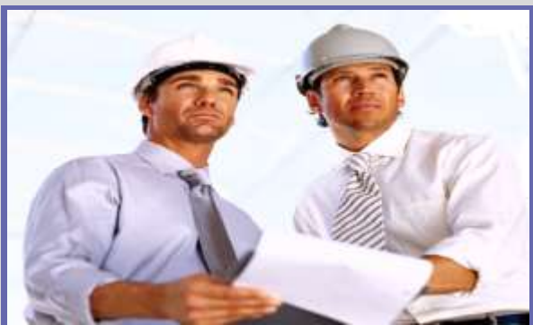
۴- مدیریت پروژه