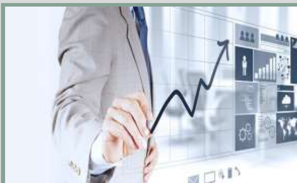
۵- مهارت مدیریتی