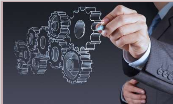
۱- دوره های عمومی